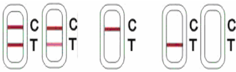
阴性 阳性 无效

阴性（-）：T线（检测线，靠近加样孔一端）显色，表示样品中吗啡浓度低于检出限或不含吗啡。 阳性（+）：T线无显色，样品中吗啡浓度高于检出限。 无效：未出现C线（对照线），可能是操作不当或试剂条已失效，应再次进行复检。